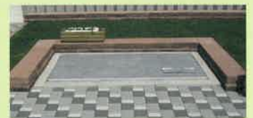
インターロッキング